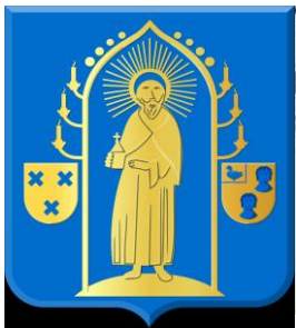
Wapen van Geffen (1817)